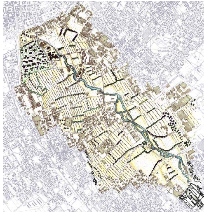
PROGETTI FUTURI INTERVISTATI: CITTADINI E AGRICOLTORI

PROBLEMATICHE E CRITICITA' in progetto di realizzazione un Parco Locale di Interesse Sovracomunale con destinazione agricola; ipotesi di realizzazione delle vasche di laminazione per il contenimento delle piene del fiume Olona.